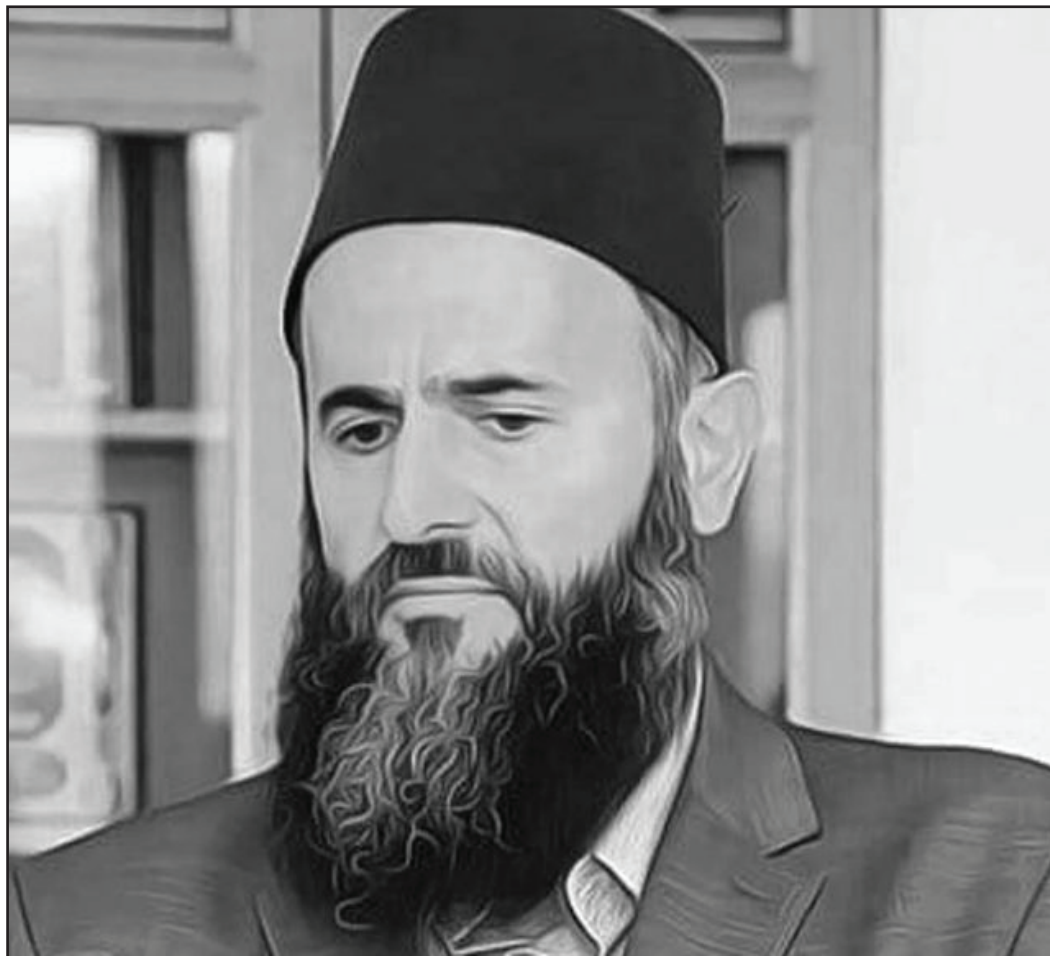
Muamer Zukorlić (1970-2021)

Tečno je govorio, pisao i čitao na arapskom jeziku. Govorio je turski jezik. Služio se engleskim jezikom. U osnovnoj školi učio ruski jezik.